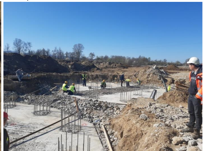
Радови на локацији ППОВ Врање дигестори муља