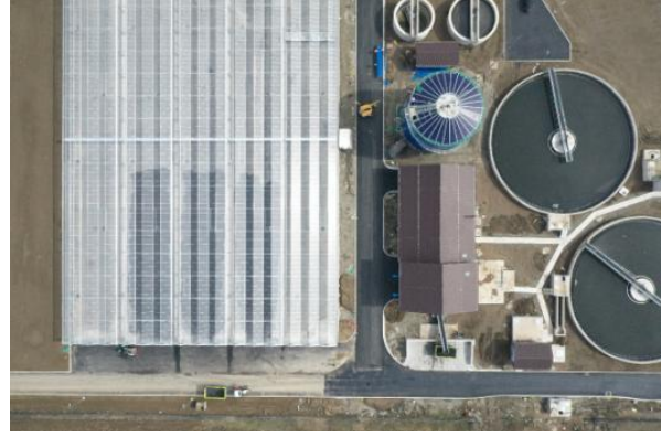
ППОВ Крушевац, обезводњени муљ депонован уОбјект 29 (Соларно сушење муља)