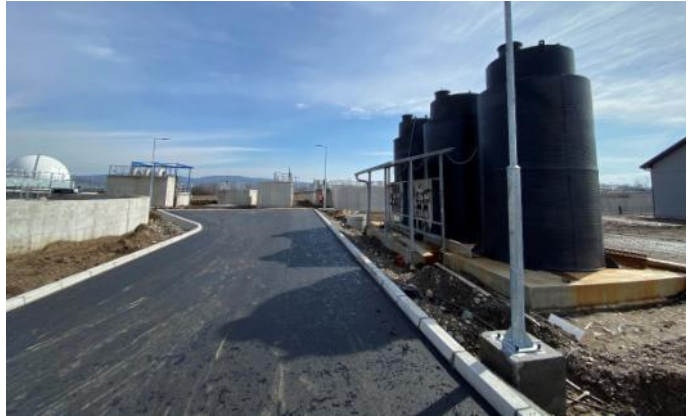
Постављање термоизолације на Објекту 9 (Анаеробни дигестор) и Станица за дозирање FeCl_3