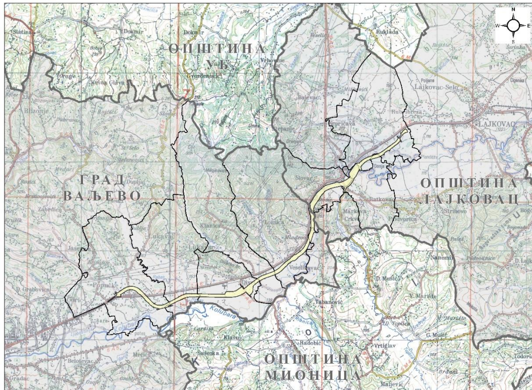
Слика 1. Положај коридора државног пута IB реда број 27, Лозница-Ваљево-Лазаревац, деоница Иверак-Лајковац