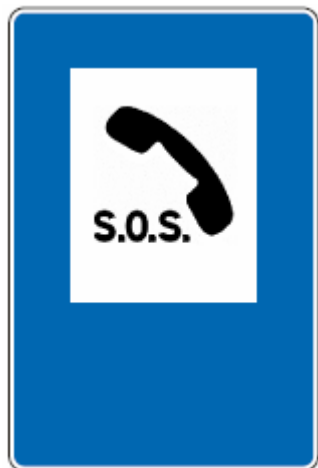
Телефон за дојаву хитних случајева